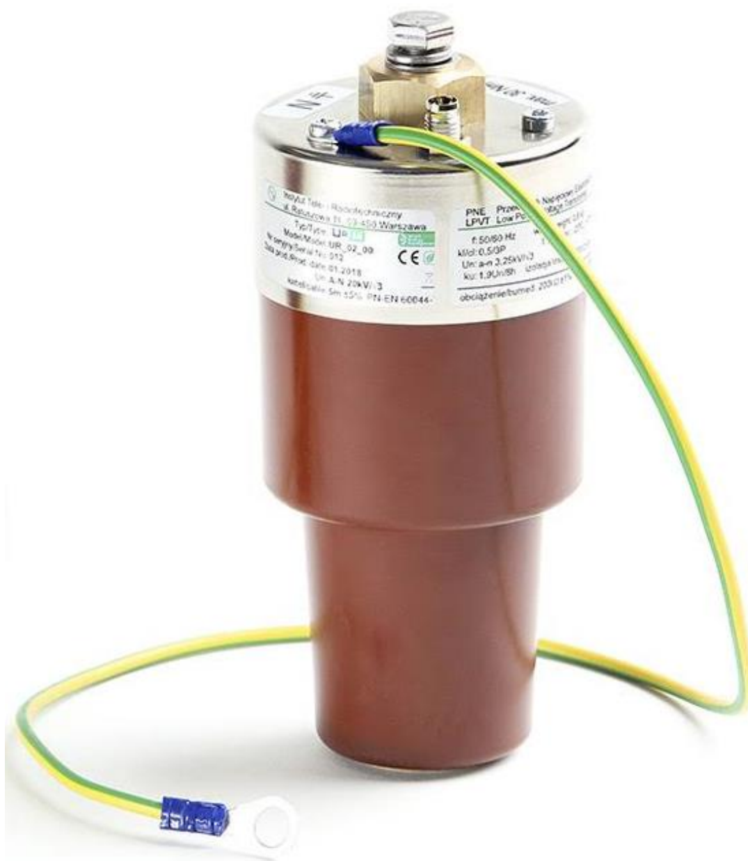
Rys. 2.3 Wygląd przekładnika